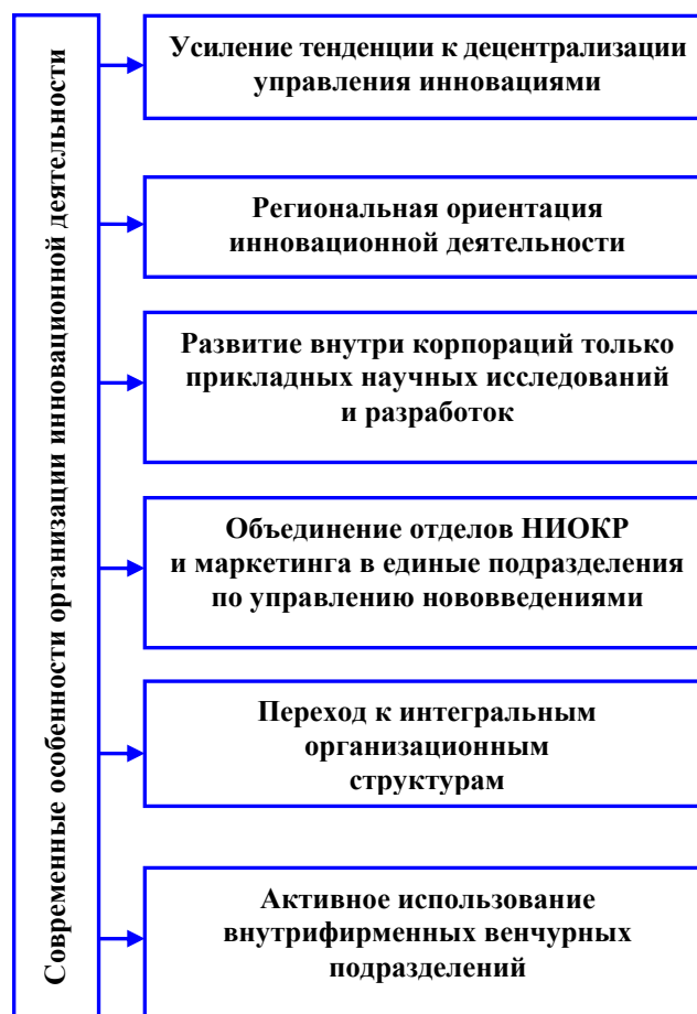
Рис. 2. Современные особенности организации инновационной деятельности

– планомерный отказ от последовательной и параллельной форм организации внедрения инновационного проекта и переход к интегральным орга-