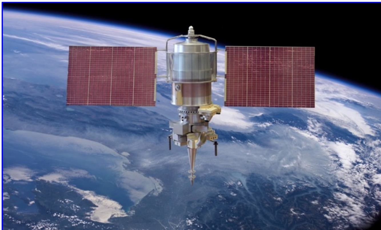
Рис. 2. КА «Метеор-3» в орбитальном полёте