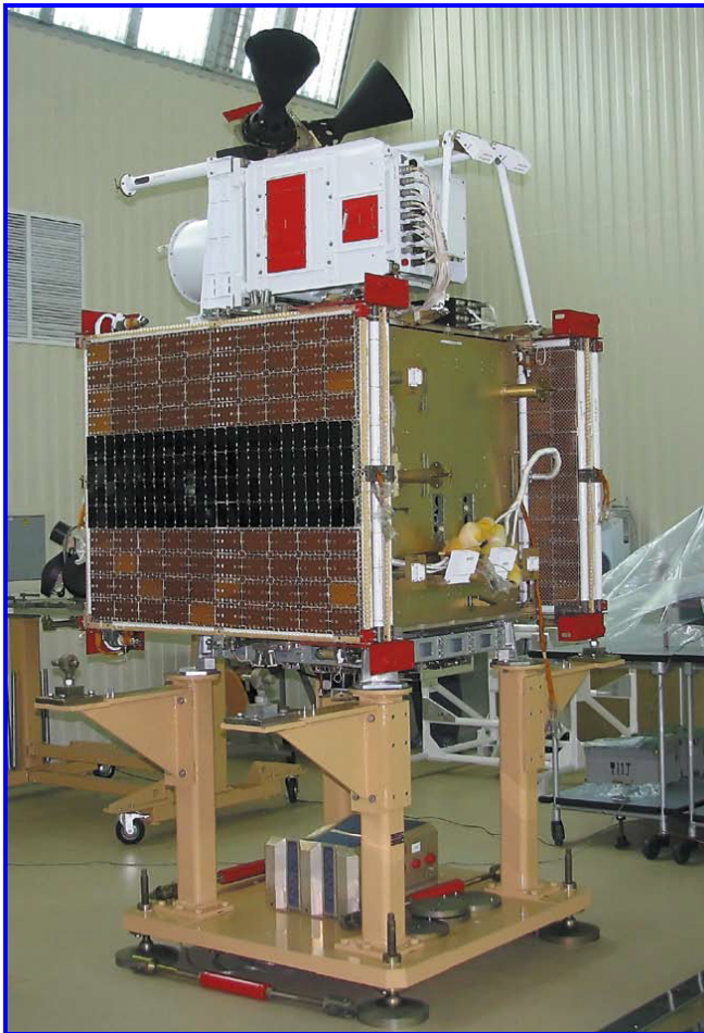
Рис. 1. КА «Канопус-В» № 1 в МИКе

С одной стороны, задачи, стоящие перед разработчиками комплекса, были актуальными. Землетрясения по всему миру приносили неисчислимые жертвы как непосредственно от катаклизмов в земной коре, так и от их последствий (цунами, оползни и т. д.). Если бы удалось найти достоверные предвестники землетрясений и зафиксировать их, например, методами дистанционного зондирования Земли из космоса, хотя бы за несколько часов до его начала, это позволило бы заранее предупредить население о грядущей беде и в результате огромное количество человеческих жизней могло бы быть спасено.